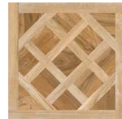
65 Royal Deco Sand 7575