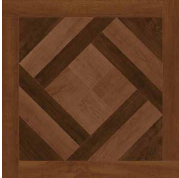
90x90 36"x36" Lakewood Coffe 9090 CSALKWCO90