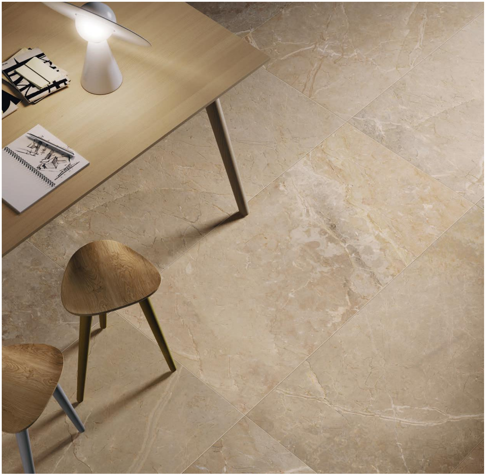
BEIGE 60X120 (24"X48") RET