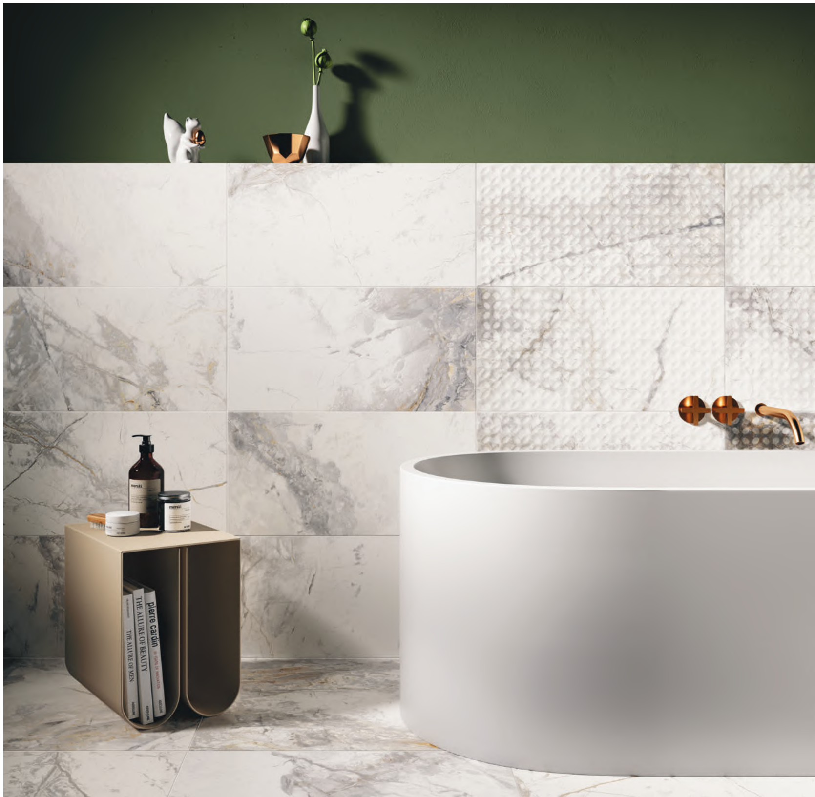
WHITE 60X60 (24X24") RET - 30X60 (12"X24") RET - 30X60 CIRCLE (12"X24") RET