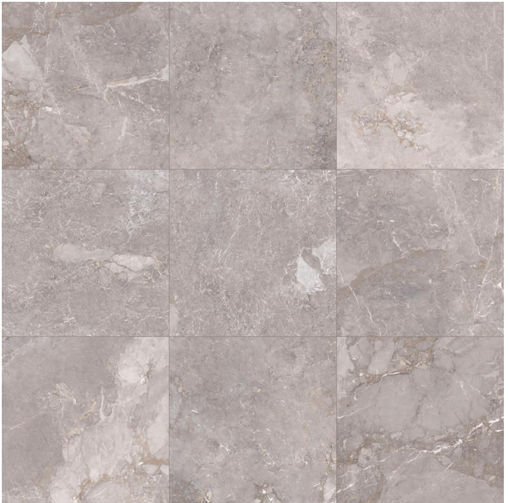
GREY 80X80 (32"X32") RET