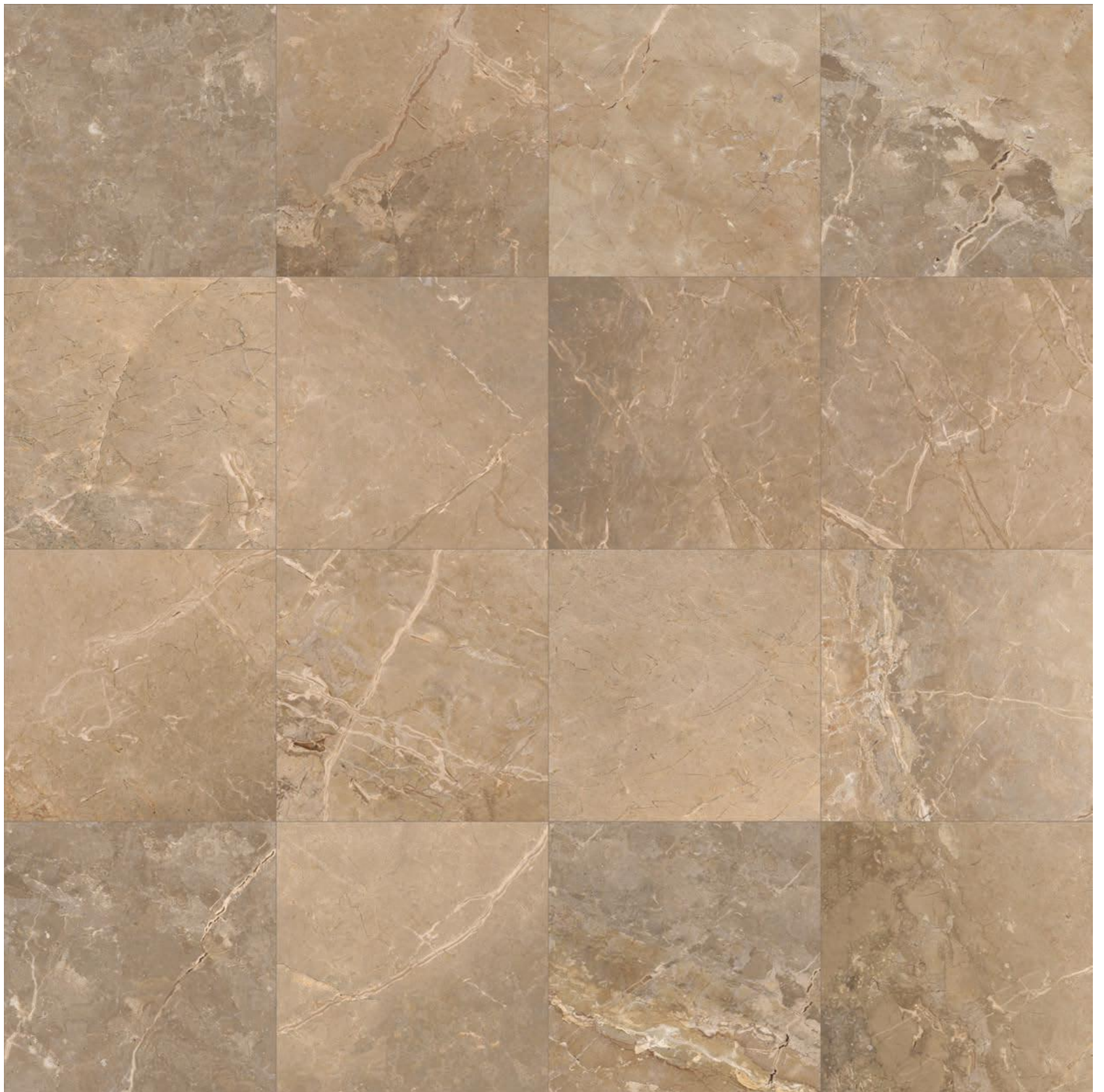
BEIGE 60X60 (24"X24") RET