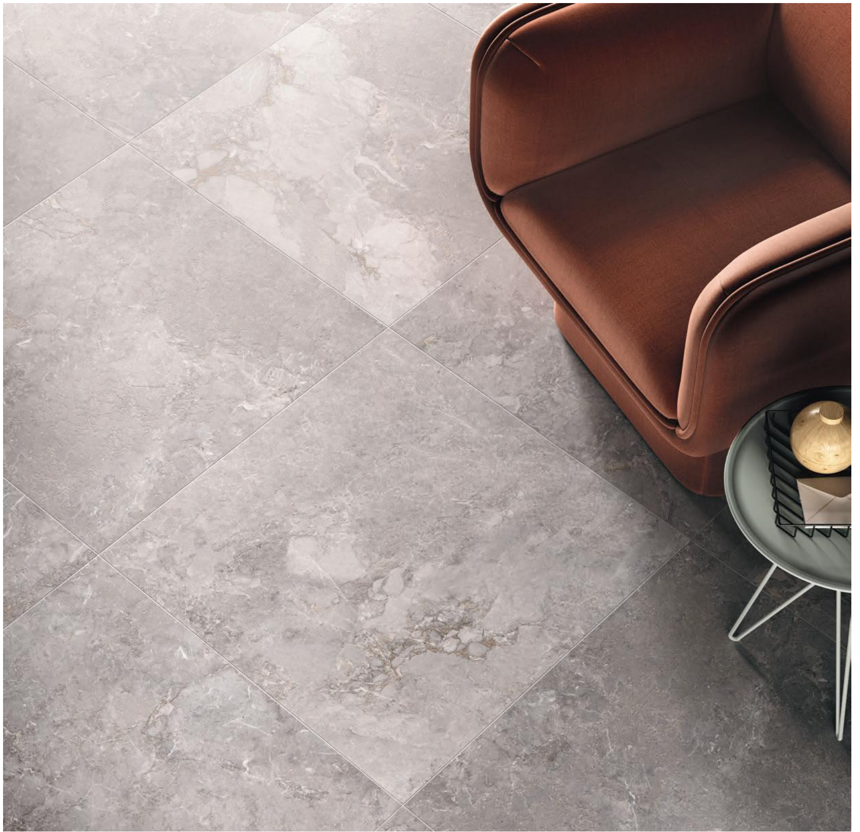
GREY 8080 (32"X32") RET