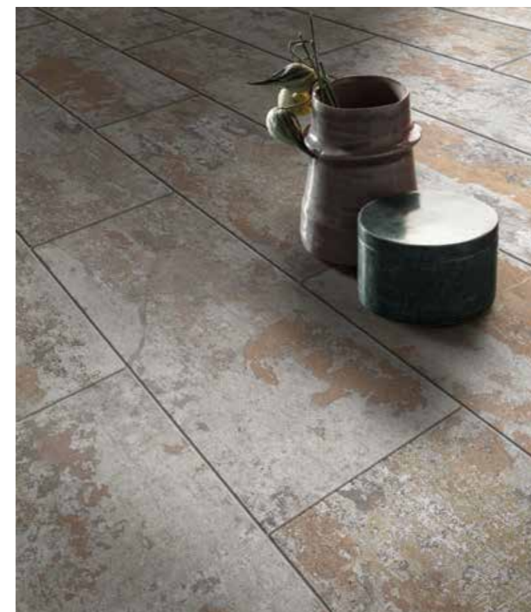
GHOST REVEAL GREY 11,5x23