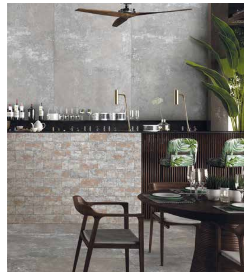
GHOST REVEAL GREY 11,5x23 - GREY 120x270, 120x120