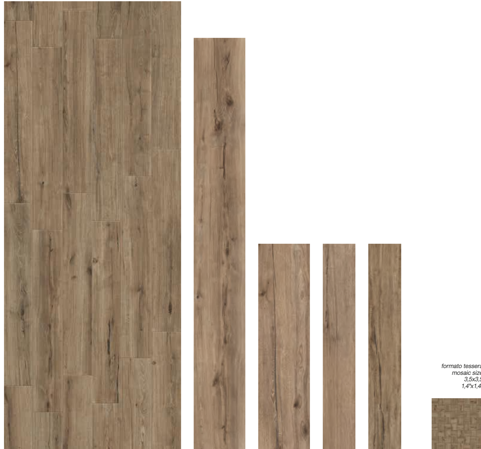
Nut 30x240 RT 12"x96" Nut 29,7x120 RT 11 7/8"x48" Nut 19,7x120 RT 7 3/4"x48" Nut 19,7x120 RT strutturato 7 3/4"x48" Nut Mosaico 29,7x29,7 12"x12" formato tessera mosaic size 3,5x3,5 1,4"x1,4"

* 14,7x120RT 5 3/4"x48 disponibile su ordinazione . available only upon request