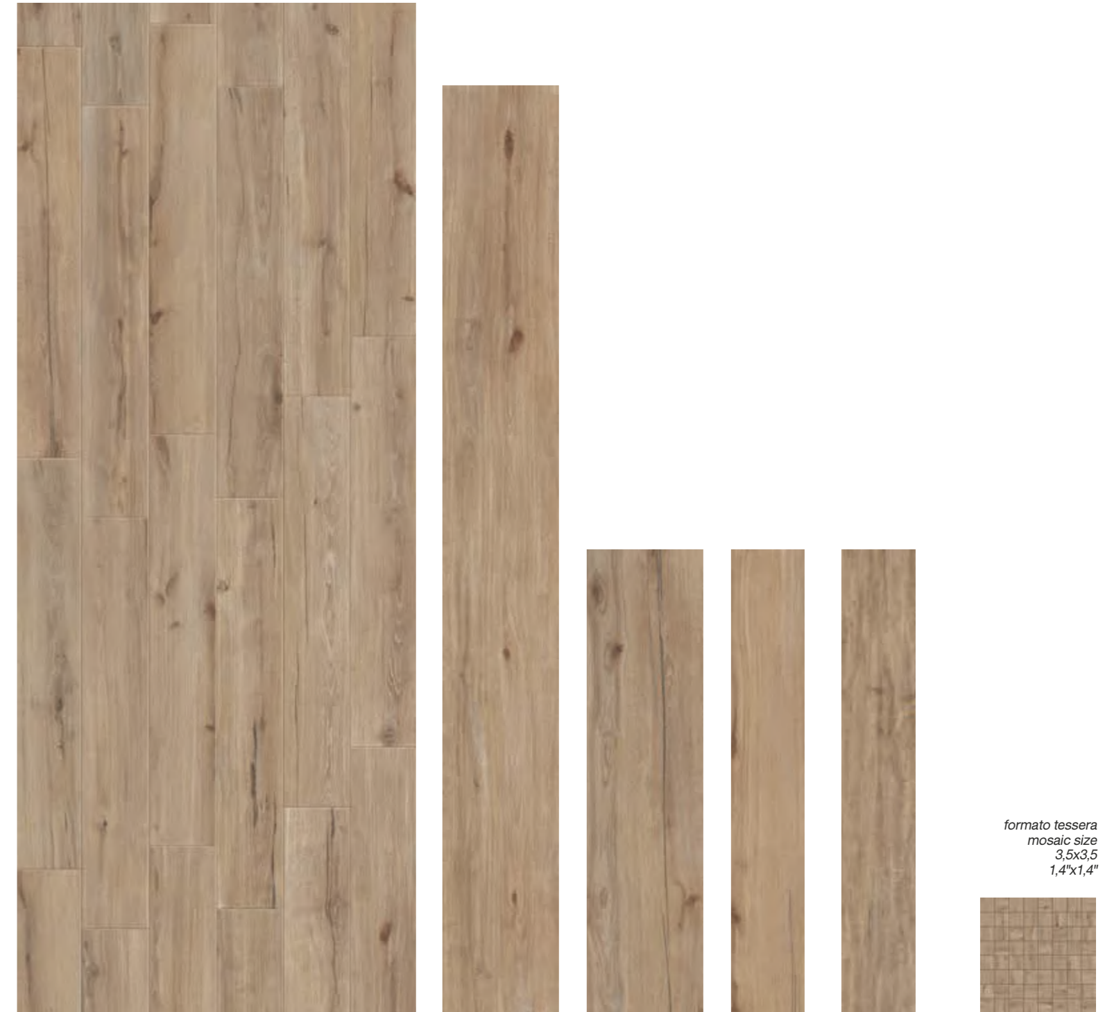
Gold 30x240 RT 12"x96" Gold 29,7x120 RT 11 7/8"x48" Gold 19,7x120 RT 7 3/4"x48" Gold 19,7x120 RT strutturato 7 3/4"x48" Gold Mosaico 29,7x29,7 12"x12" formato tessera mosaic size 3,5x3,5 1,4"x1,4"

* 14,7x120RT 5 3/4"x48 disponibile su ordinazione . available only upon request