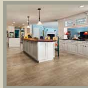
Aspen Natural 14-15