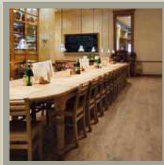
Aspen Sunset 12