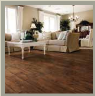
Aspen Cherry 8-9